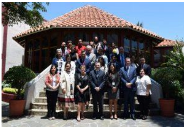
Santa Cruz de la Sierra (Bolivia)

Ter versterking van de contacten in de regio hebben, op uitnodiging van de SER van Spanje en het Spaanse Agentschap voor Internationale Ontwikkelingssamenwerking (AICED), enkele SER-medewerkers ook deelgenomen aan een regionale bijeenkomst in Santa Cruz de la Sierra (Bolivia) met als thema: 'Cohesión social y gobernabilidad; el papel de los Consejos Económicos y Sociales y el diálogo con los agentes económicos y sociales'. Van die gelegenheid werd gebruik gemaakt om met de coördinator van het regionale netwerk van SER'en, Consejos Económicos y Sociales de América Latina y del Caribe (CESALC), te weten de SER van Guatemala, nadere afspraken te maken over reactivering van het netwerk en de aanzet voor een regionale agenda.